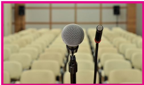
Conférence de presse de lancement du premier projet en réseau: ROAD sur l'arthrose

Dans le cadre du projet MIRIAD, les chercheurs mettent en évidence un lien entre microbiote intestinal, terrain génétique et inflammation dans la spondylarthrite ankylosante