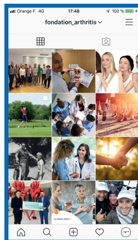
Création du compte Instagram @Fondation_arthritis